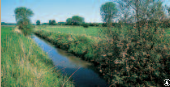
4 Courant du Décours.

au Moyen Age. Leur forte présence à cette époque, se devine aujourd'hui dans les vestiges de nombreuses abbayes autour de Marchiennes et dans la physionomie de la plaine de la Scarpe.