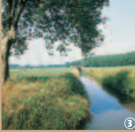
3 Courant du Décours.

La vallée de la Scarpe est tout simplement, un pays d'eau ; marais, terrains détrempés et prairies inondables sculptent le paysage. Mais l'Homme, avec sa volonté de vouloir tout contrôler, est parvenu à détourner cet obstacle aqueux à son profit. Étonnement, l'aménagement de la vallée est l'acte des moines, qui peuplaient le domaine