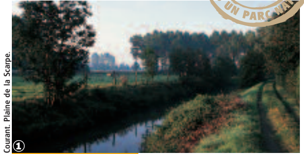
1 Courant. Plaine de la Scarpe.

Randonnée VTT Circuit du Maraîchon : 8,5 km