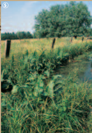
5 Près de Wangignies-Hamage.

C'est ainsi qu'est né le Maraîchon, appelé aussi « Marîchon » ; ce canal a été creusé pour maîtriser le niveau de la Mer de Flines, cet étang quasi circulaire de 600 m de circonférence ; il entraîne le trop plein jusqu'au Décours à l'entrée de Marchiennes.