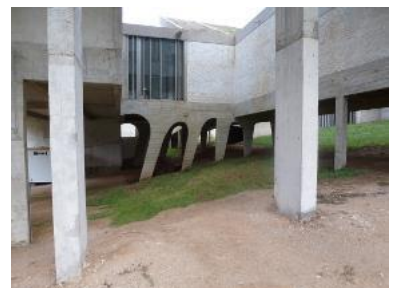
Le couvent de la Tourette construit à Evieux entre 1956 et 1960