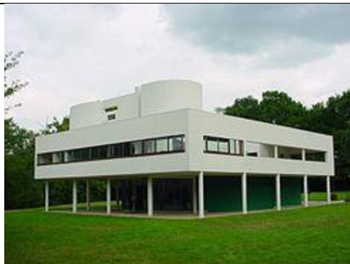
La villa Savoye a été construite entre 1928 et 1931 à Poissy (France)