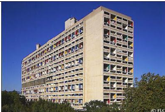
Il construit la cité radieuse avec son toit terrasse en 1952 à Marseille