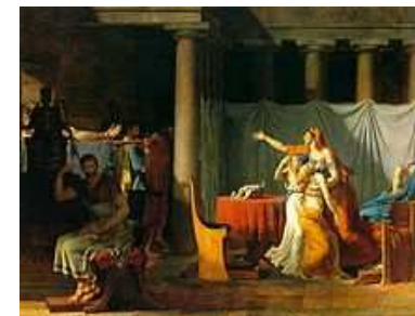
Les licteurs apportant à Brutus le corps de ses fils, par Jacques Louis David (1789)

En 507, défen... Horatius Coclès est seul, contre l'armée ennemie, à défendre le Pont Sublicius donnant accès à la ville de Rome, en