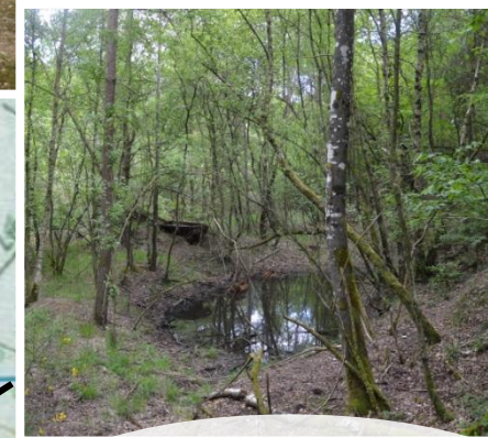
2 petites mares ; point de ravitaillement... ... pour les animaux !