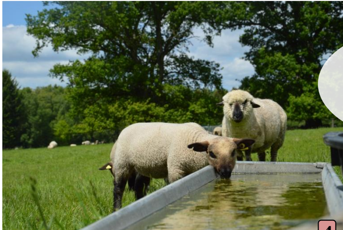
A la Fortinière, une pause s'impose devant l'élevage d'agneau