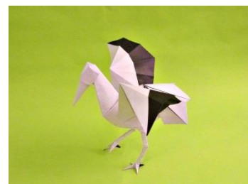
en papier noir-blanc : Canson