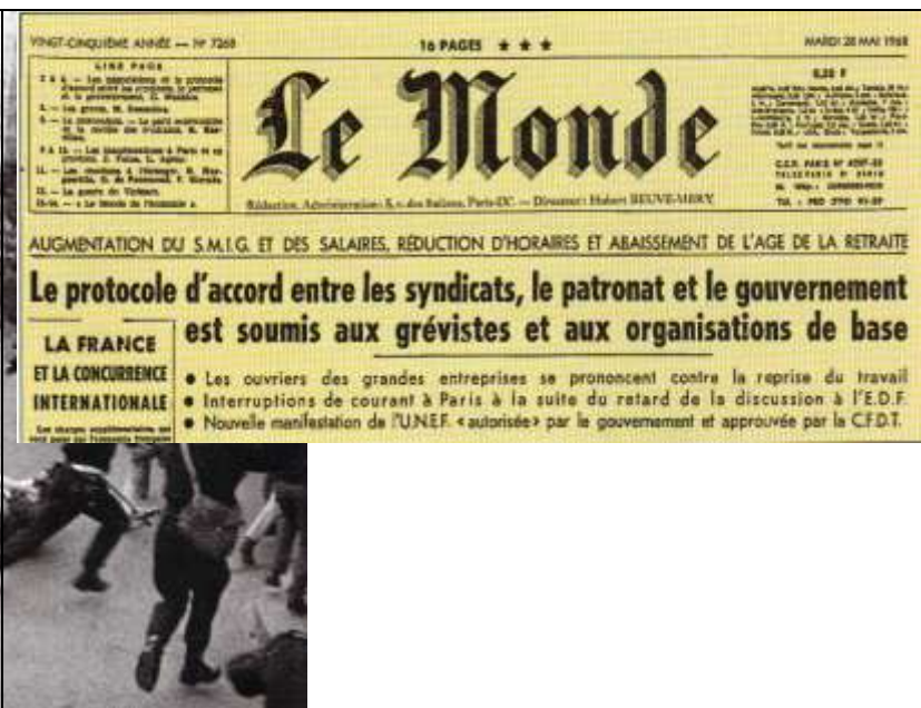
Document 4 : Une solution pour sortir de la crise : « les accords de Grenelle »