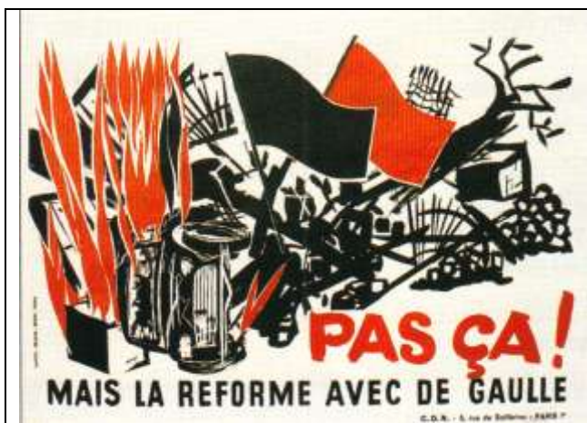
(Tract des Comités pour la défense de la République, créés pour soutenir de Gaulle.) Le drapeau noir symbolise l'anarchie, le rouge le communisme.