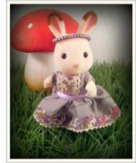
Robe cousu pour un lapin des Sylvanian Families