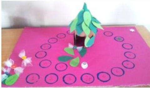
Tutoriel : jeu de l'oie « fée clochette »

Tutoriel réalisé pour le site Purefamille.com