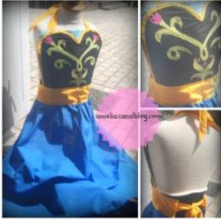
Couture : Tablier d'Anna Création personnel