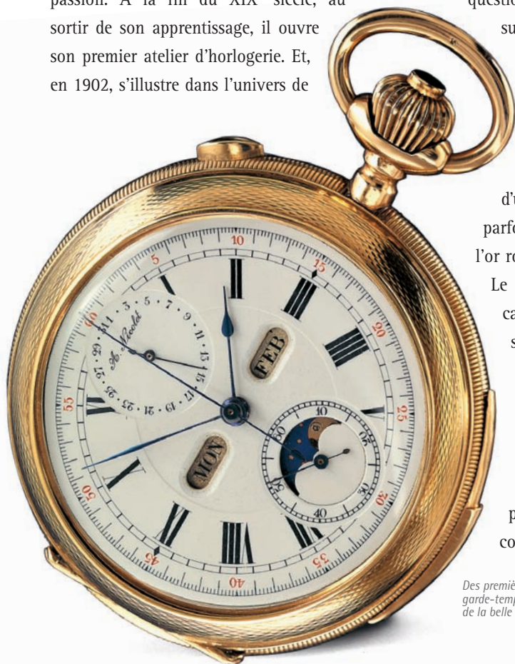
Des premières montres de poche aux garde-temps d'aujourd'hui, la tradition de la belle horlogerie classique perdure.

Tenu en laisse par un bracelet cuir de crocodile, le temps servi par cette réincarnation des valeurs originelles de l'horlogerie se devait de s'entourer d'attentions subtiles: décorations Côtes de Genève, rhodium perlé, index appliqués à la main, étanchéité à 5 atmosphères et réserve de marche de 36 heures. ■