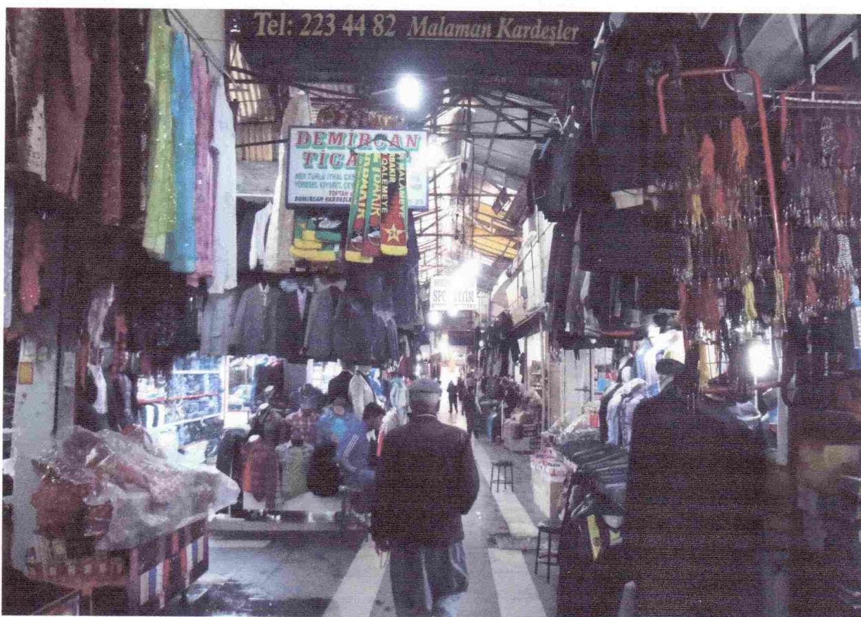
Bazar de Diyarbakir.

Le 10 avril , dimanche «pazar» lever tôt et visite de la ville à pieds, le bazar, la mosquée et le caravansérail, belle ville (capitale Kurde) construite au bord du Tigre avec un mur d'enceinte de 5 kilomètres de long. L'après midi nous allons à Elazig, nous trouvons un hôtel avec parking au centre ville, petit tour à pieds. Le soir nous allons dîner dans un restaurant près de l'hôtel, nous sommes très bien reçu, le repas est extra, les Turcs ne trahissent pas leur réputation.