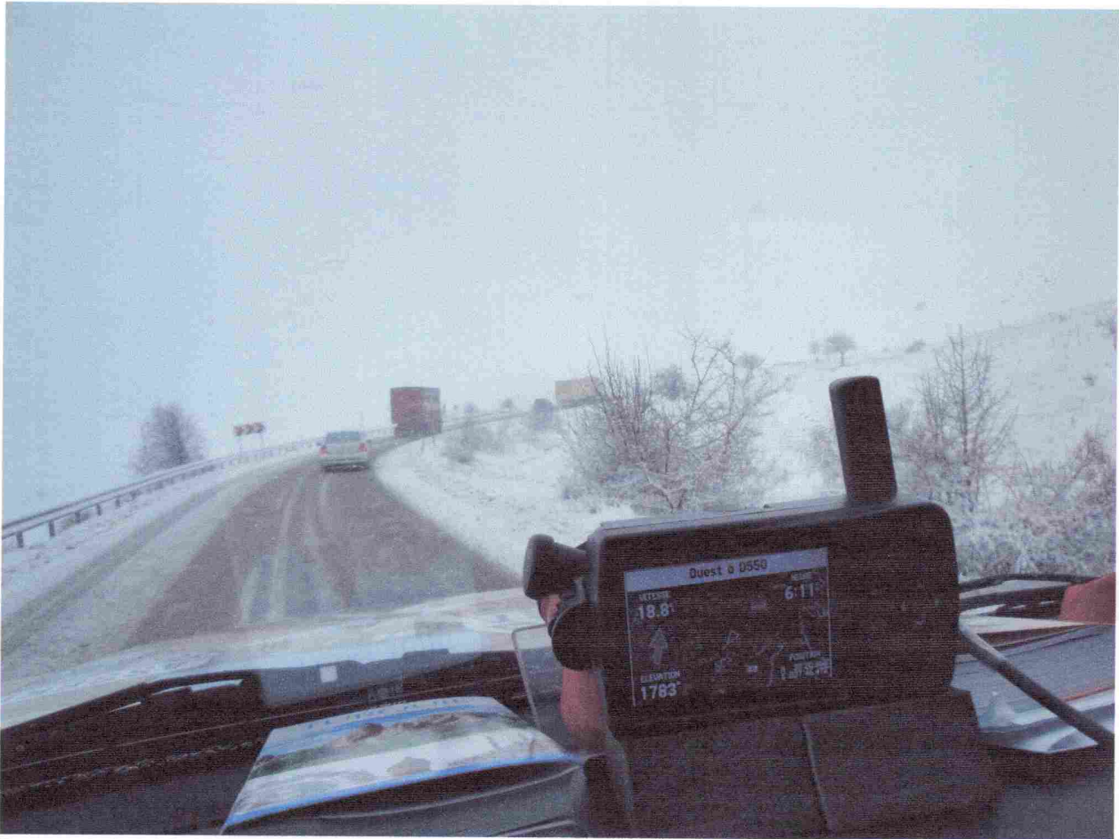
Passage de col (18.8 km/h, 18h11, 1783 m et nous ne sommes pas au sommet).

Le 12 avril , après les frayeurs d'hier, nous avons tous passé une bonne nuit. Nous déjeunons au restaurant voisin de l'hôtel ou nous avons dîné hier soir. Ce matin nous prenons la direction de Kayseri et la Cappadoce. Déjeuner à la sortie de Kayseri dans un restaurant moderne, au menu spécialités. Arrivée en Cappadoce à Goreme en milieu d'après midi, avec le beau temps mais froid car c'est le vent du nord, nous prenons des chambres à la pension Ufuc (60 TL pour 2 personnes et petits déjeuner soit: 27,50 €). Dîner traditionnel viande et légumes dans des pots en terre à casser en deux au moment de manger.