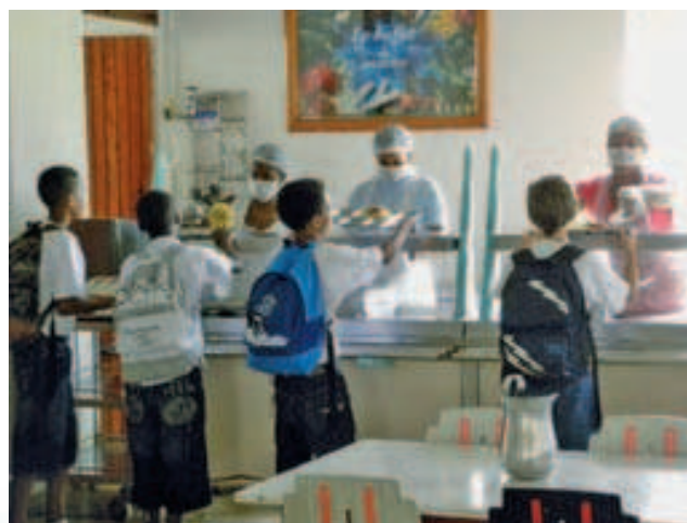
Chaîne de distribution de repas au collège MATOUBA

Cette philanthropie a été remise en cause par la Chambre Régionale des Comptes, pour des raisons de contraintes budgétaires, et la collectivité s'est recentrée sur les compétences qui lui sont dévolues, en incitant ses partenaires (Conseil Général, et Rectorat) à prendre leur responsabilité dans leur domaine respectif.