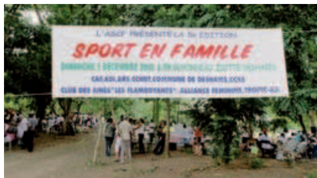
Accueil de la manifestation

L'équipe municipale très engagée auprès des familles, a effectué le déplacement pour partager ce moment exceptionnel de convivialité et de détente avec les invités.