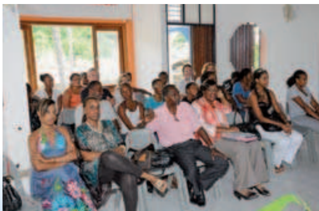
Un public nombreux pour encourager les lauréats