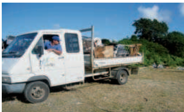
Acheminement de déchets vers la zone de stockage temporaire de ZIOTTE

Les administrés seront désormais responsables de leur véhicule hors usage, pour son acheminement et sa destruction vers le centre de traitement sous peine d'une contravention.