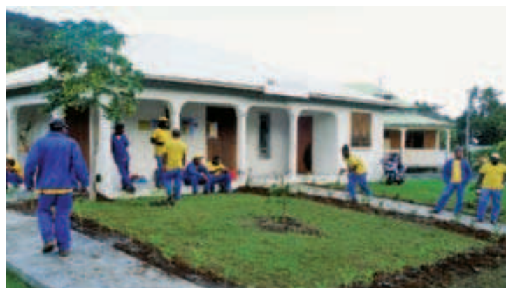
Constructions et embellissement des accès de la maison des aînés

Le Chantier Ecole forme des jeunes femmes à l'animation périscolaire dans les écoles de caféière, de Rifflet, de Bethsy, et de Ferry.