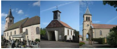
Evette-Salbert - Errevet - Lachapelle sous Chaux - Sermamagny