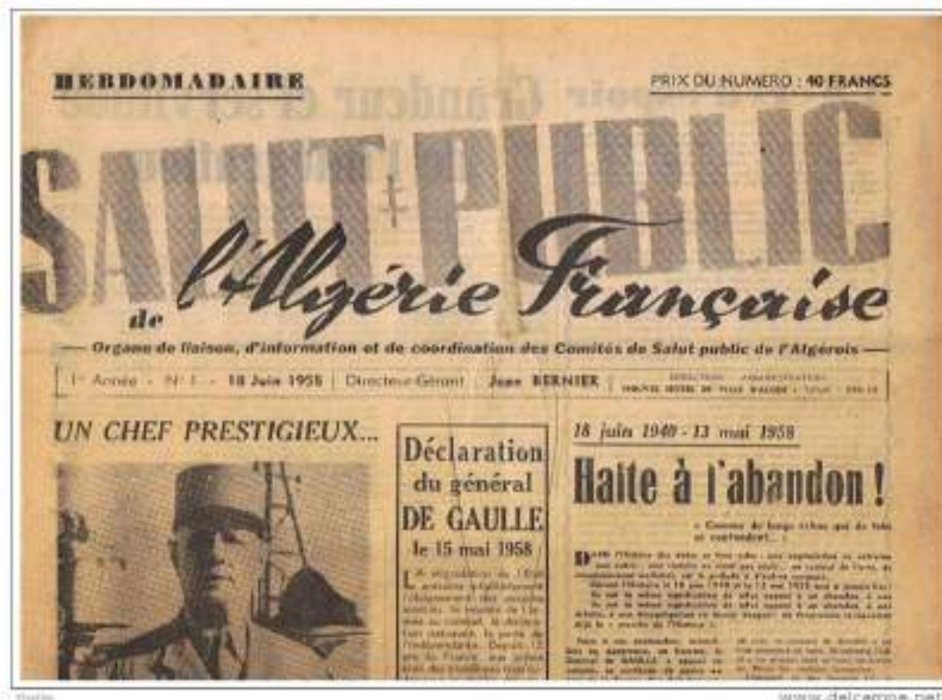
Salut Public du 18 juin 1958