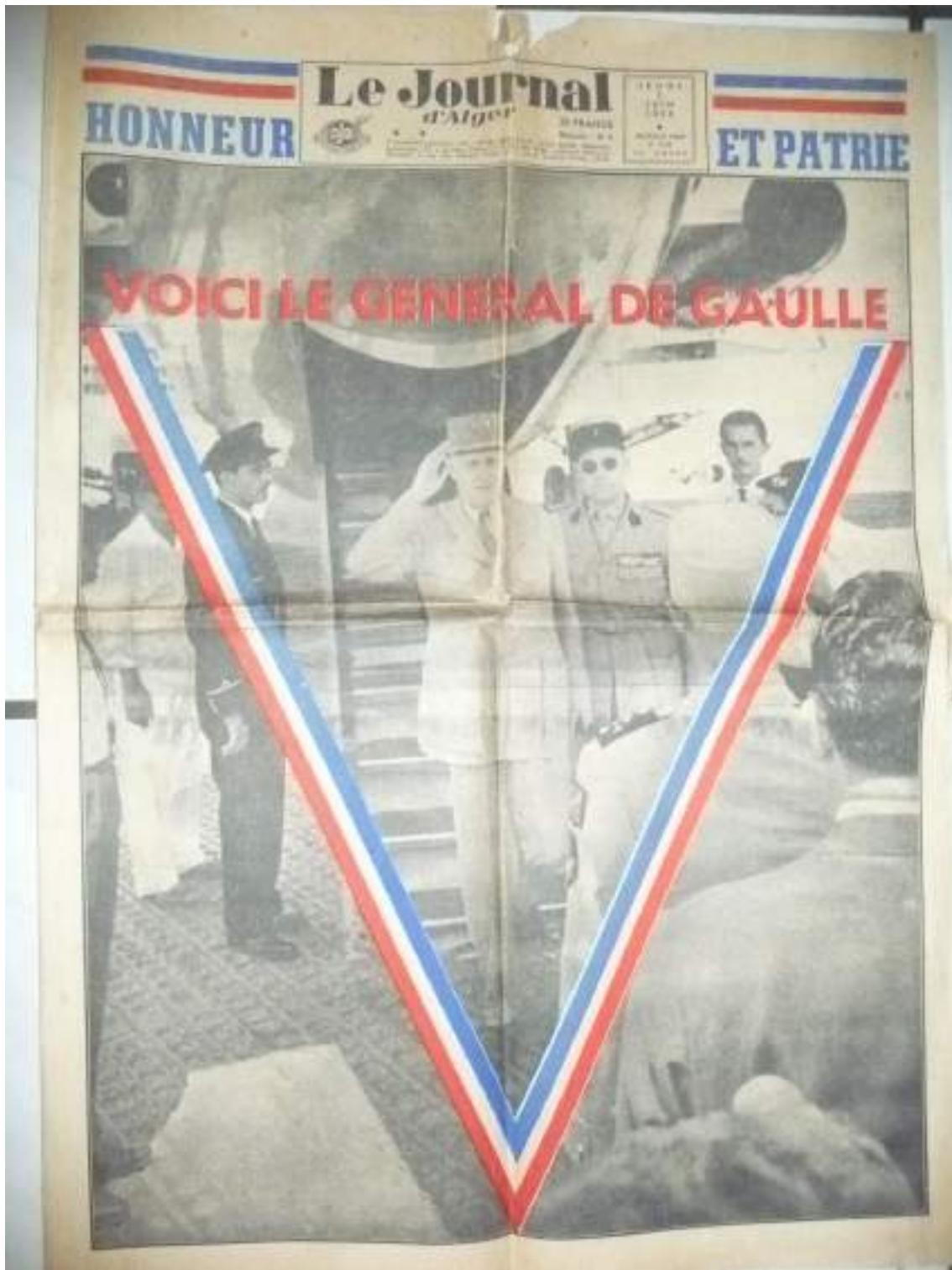
Le Journal d'Alger du 5 juin 1958