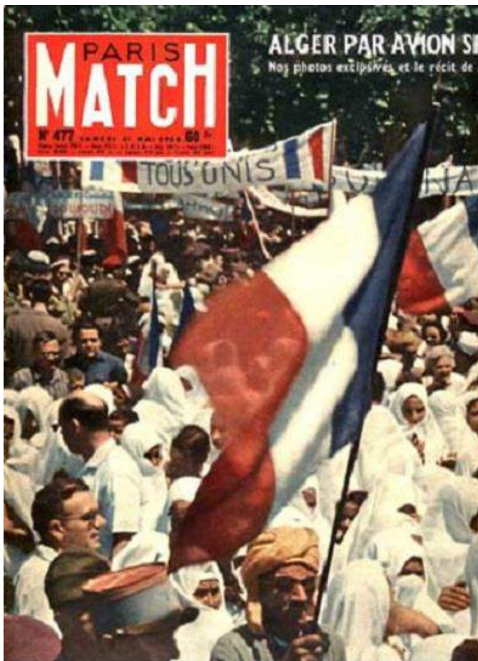
Paris Match du 31 mai 1958