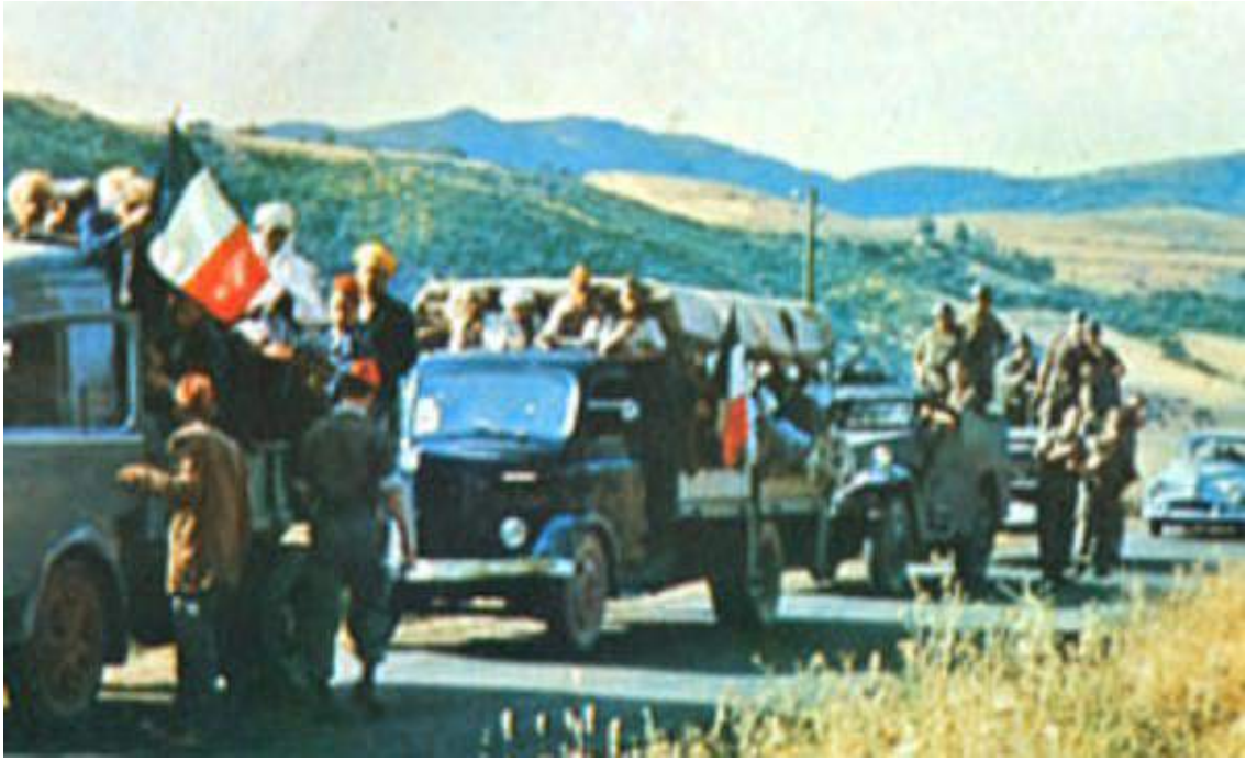
En route !