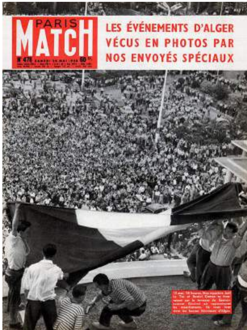
Paris Match du 24 mai 1958

Le 28 mai 1958, venant d'Alger, le général André DULAC, représentant le général Raoul Salan, arrive en mission spéciale à Colombey-les-Deux-Eglises. De Gaulle fait transmettre au général Salan le message suivant :