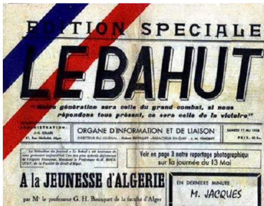
Le Bahut du 17 mai 1958