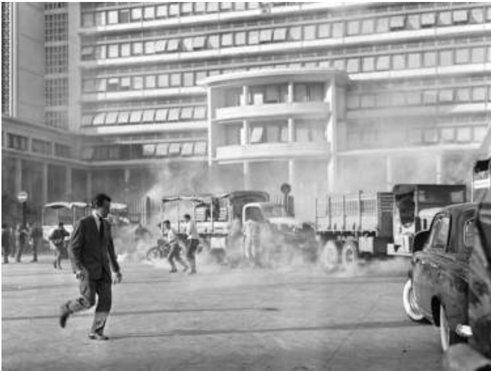
Le Gouvernement Général GG