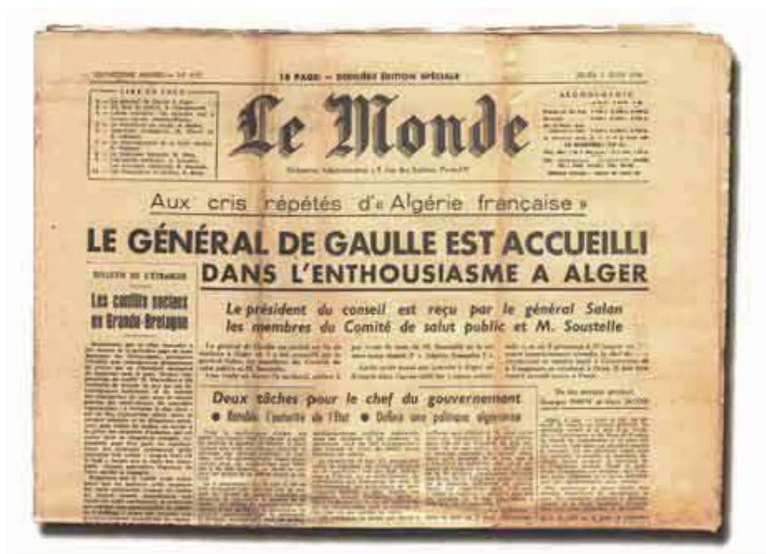
Le Monde du 5 juin 1958