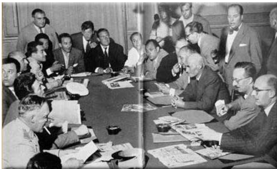
Ajaccio 24 mai 1958