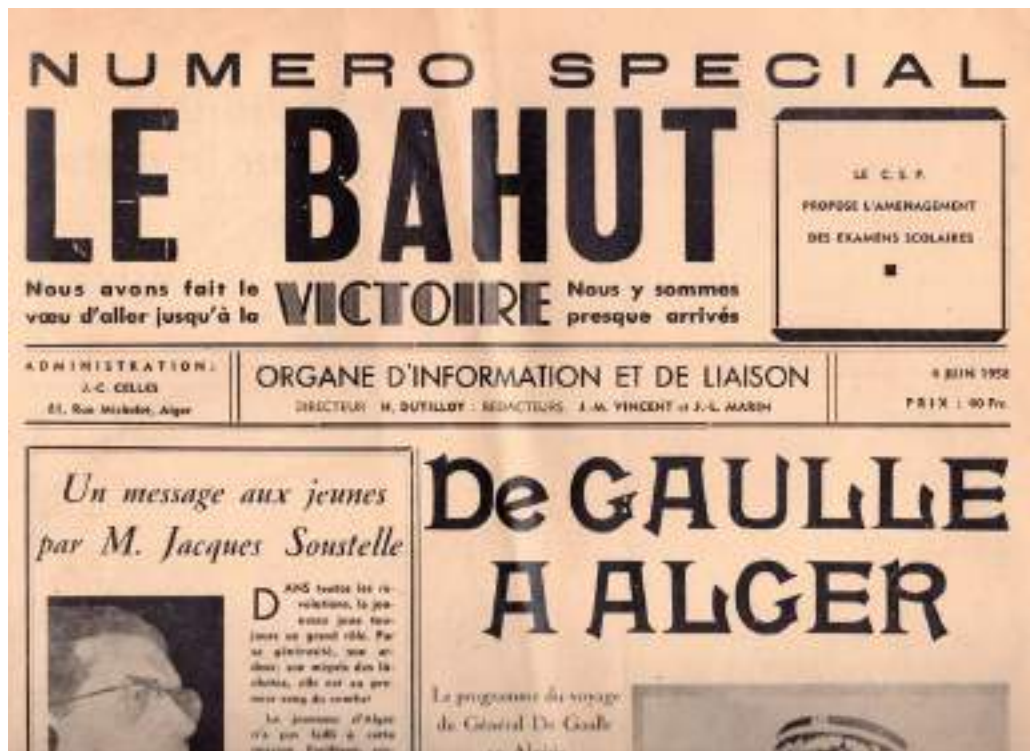
Le Bahut du 4 juin 1958

Du 4 au 7 juin 1958, premier voyage en Algérie du général de Gaulle