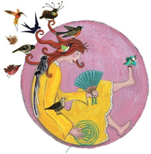
Illustration : Anne des Prairies