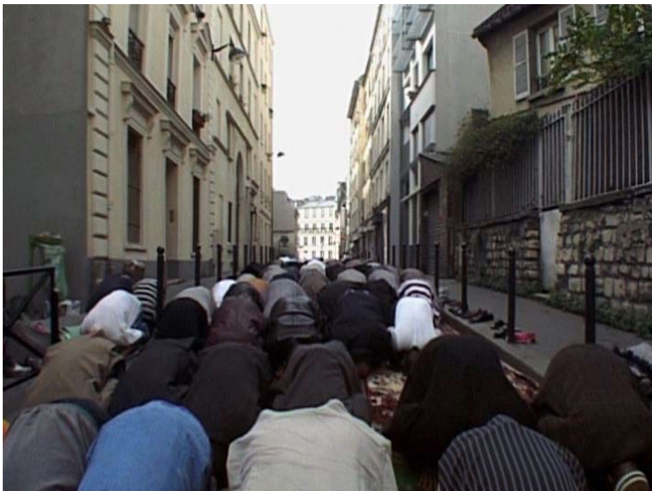
© Florence Lazar, La prière - 2008 - Vidéo (extrait)