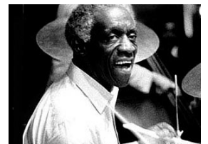
Enregistré en 1958

le piano « lance le thème » et les autres instruments lui répondent