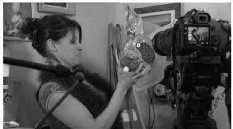
Francetv 15 days ago

Une propriétaire bisontine crée un blog pour que ses locataires s'expriment via Webcams - Début de l'aventure 2.0 de ces bisontins jusqu'au 3 février - http://25courvauban.fr/