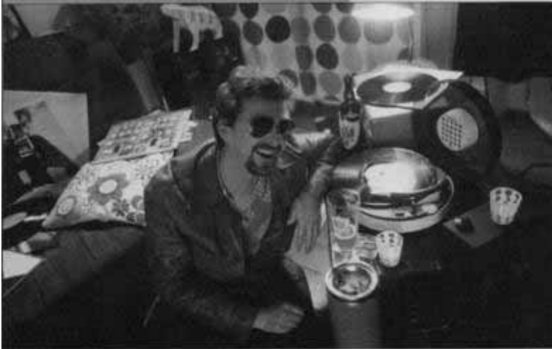
STEPHAN LHULLIER, COMÉDIEN, EN PLEIN TOURNAGE DE "25 COUR VAUBAN"