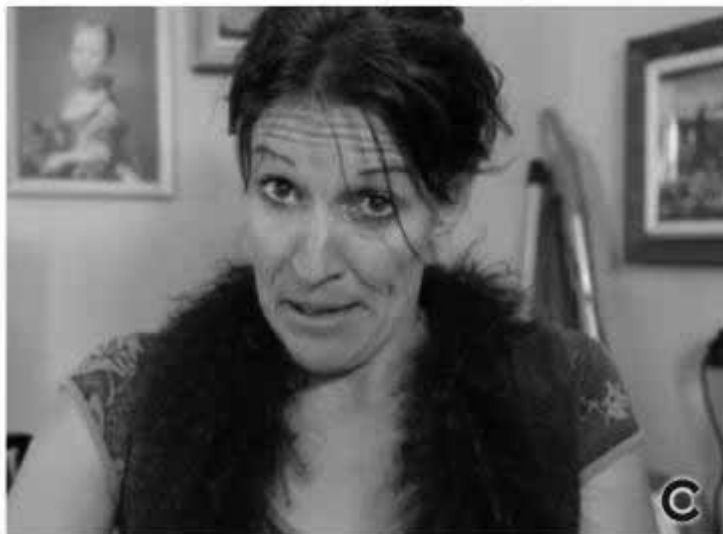
la concierge "empotée" avec internet dans la web fiction "25 cour Vauban"