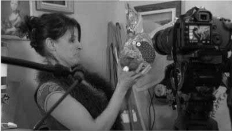
Le tournage de cette webfiction a eu lieu intégralement à Besançon.

« 25 cour Vauban » une création 100% bisontine à voir dès aujourd'hui !