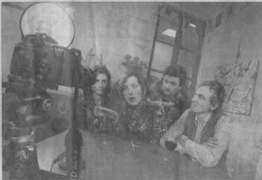
■ Tournage live du dernier épisode des tribulations du 25 Cour Vauban

Les comédiens de la compagnie Colibri, se retrouvent, le tournage date de décembre, ils sont surpris par l'ampleur et la forme prise par le projet qu'ils n'ont vu