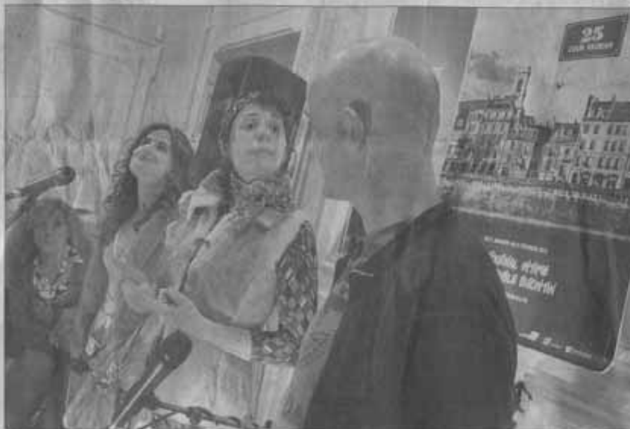
■ Les comédiens de la Compagnie du Colibri : « Faire plaisir et se faire plaisir ».

Aujourd'hui, les séquences mettent leur costume de websérie, comptes facebook,