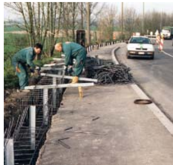
Le pont Festu, situé le long de la RN 7 à hauteur de Pipaix, sera reconstruit. Une convention vient d'être conclue entre les Travaux publics et la SNCB en matière de répartition du coût des travaux.