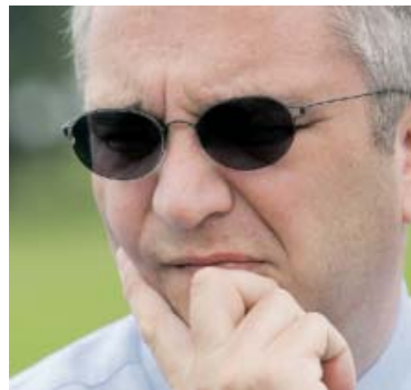
Pas un jour ne passe sans nouvelles révélations mettant en cause le fils cadet du Roi. Cette fois, c'est le colonel Vaessen, lui-même inculpé de fraude et ancien conseiller du Prince, qui balance dans la presse flamande.

Besoin d'un fumoir dans votre établissement ?